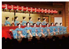
都をどり

● 「令和六年 第百五十回記念公演 都をどり」 祇園甲部の春の舞を 一等席より観覧