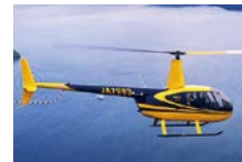
ヘリコプター イメージ

奈良市内～天理～明日香～吉野山千本桜を上空から遊覧(往復1時間の搭乗) *天候・気象条件によっては遊覧内容を変更または運航中止となる場合がございます