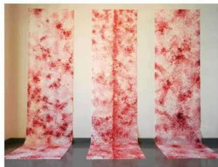
"Rivers in the body" 90cm x 360cm each Acrylics on Japanese paper/2015