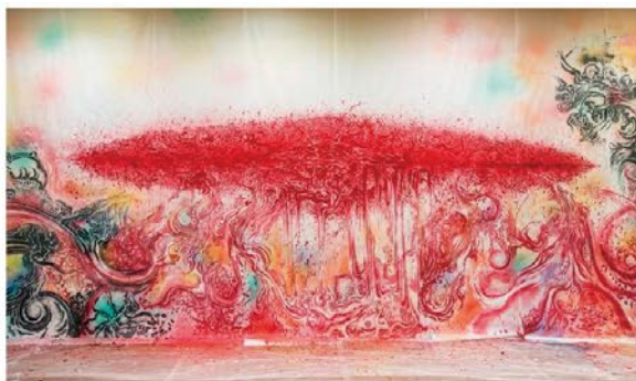
"Eternity" 3.6m x 7.2m Acrylics on Japanese paper/2016