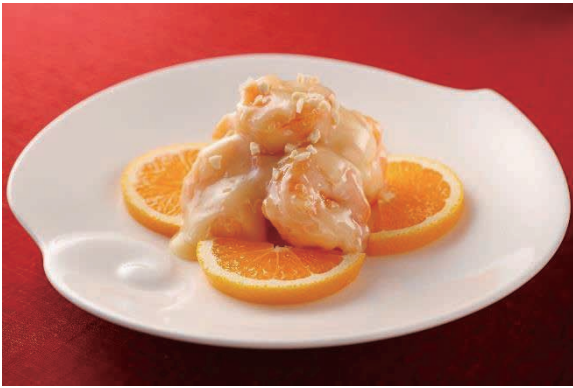
海老のマヨネーズ和え