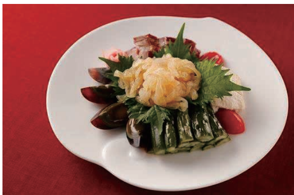
五種冷菜盛り合わせ