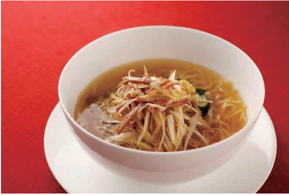
チャーシュー細切り葱汁そば