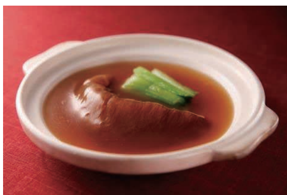
ふかのひれの姿煮込み