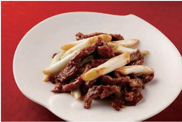
牛フィレ肉と白葱の炒め