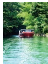
三方五湖ネイチャークルーズ