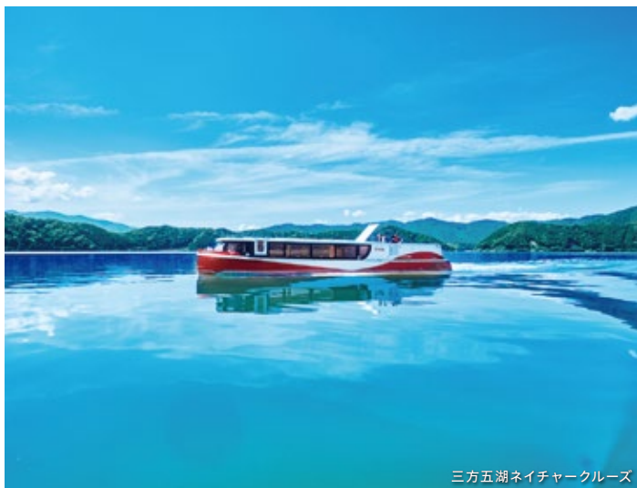
三方五湖ネイチャークルーズ