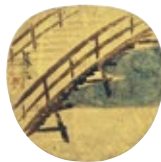
尾形光琳《宇治橋図回扇》 江戸中期 細見美術館蔵